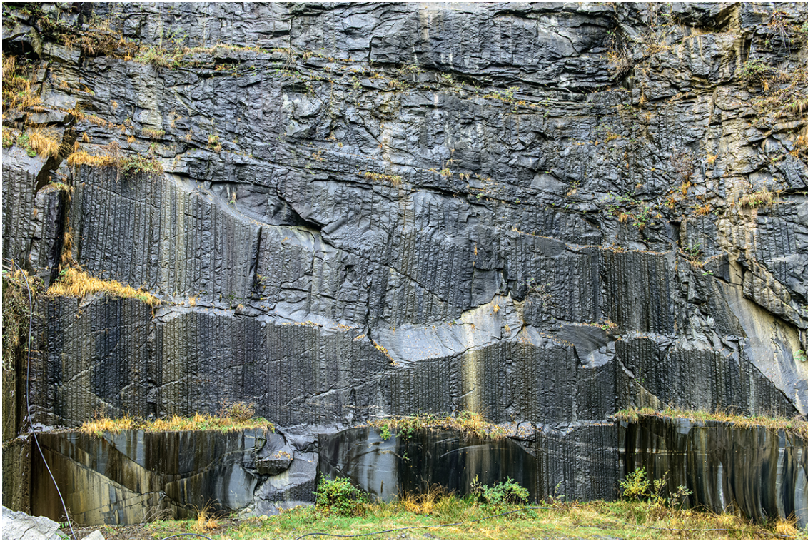
Steinbruch des Bodio Nero's in Personico (TI) von Ongaro & Co SA.