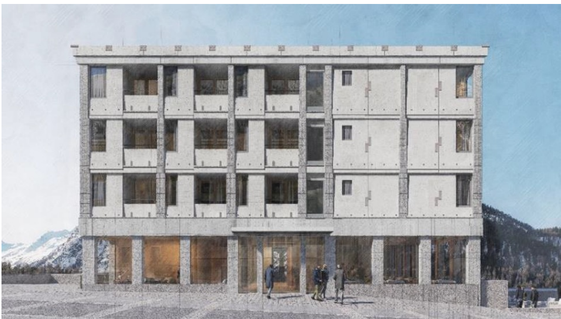
Visualisierung des Hotels Maistra in Pontresina

Der Neubau befindet sich mitten im Ortskern, wird über 36 Doppelzimmer und 10 bewirtschaftete Lodges verfügen und soll im November dieses Jahres eröffnet werden. Mit seinen vielfältigen Angeboten richtet es sich dabei nicht nur an Gäste, sondern auch an Einheimische.