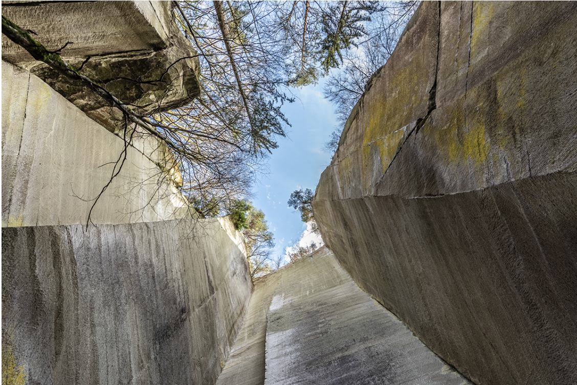
Berner Sandstein im Steinbruch Museum Krauchthal.

Die Schweiz zählt derzeit etwa 70 aktive Steinbrüche. In oftmals abgelegenen, unwegsamem Gelände wird unter Einsatz von schwerem Gerät der Fels in grosse Blöcke unterteilt und zur Weiterverarbeitung abtransportiert. Dabei entstehen Orte von einzigartiger, rauer Schönheit. Eine freundschaftlich organisierte Arbeitsgruppe aus Architekten hat in den letzten zwei Jahren ein Dutzend Schweizer Steinbrüche besucht und porträtiert. Mit der Unterstützung des Naturstein-Verband Schweiz NVS zeigt die SBCZ bis zum 21. April 2023 die aus diesen Besuchen entstandene Ausstellung «Natur-Stein-Werk».