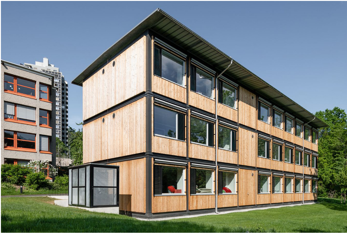
Schulpavillon aus ZM10-Modulen, Sihlweid Zürich, Blumer Lehmann