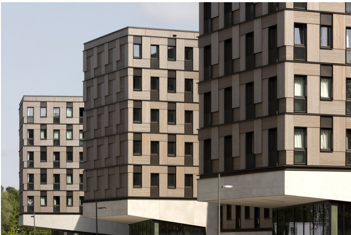
Universal Design Quartier, Hamburg, Sauerbruch Hutton, 2017

Die Produktion von Holzmodulen im Werk von Blumer-Lehmann folgt klar strukturierten Arbeitsabläufen. Auf einer modernen, automatisierten Produktionsstrasse werden einzelne Bauteile sequenziell zu montagefertigen Holzmodulen zusammengefügt. Die im Holzrahmenbau hergestellten Module erreichen einen Vorfertigungsgrad von bis zu neunzig Prozent. Dank der Modulbauweise können die Produktion im Werk und Vorarbeiten auf der Baustelle parallel ablaufen, was eine hohe Termin- und Kostensicherheit gewährleistet.