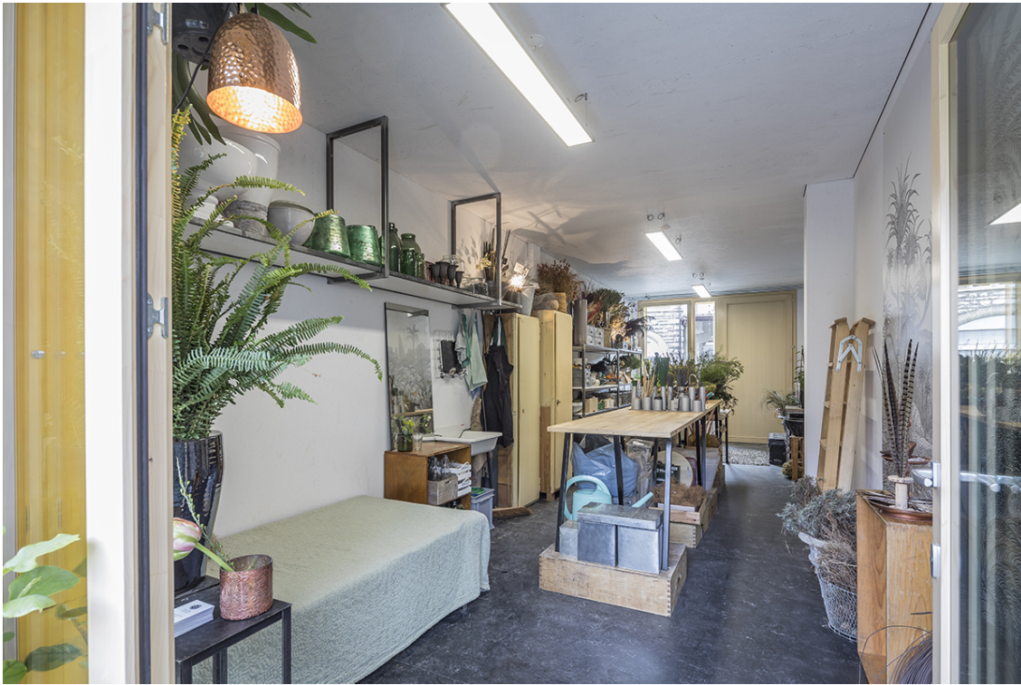
Ein Atelier im Holzmodulbau Lattich, St.Gallen, Baubüro in situ, 2018