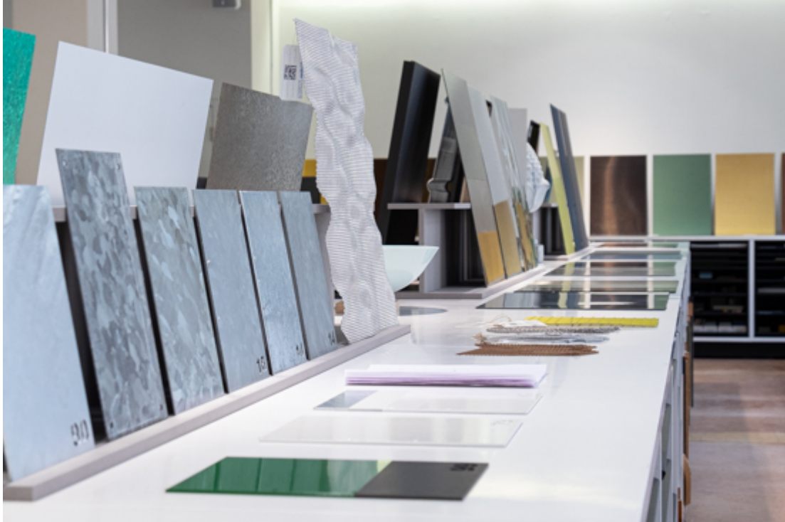
«Reaktionen auf Metall» ab dem 16. April in der SBCZ

Metalle sind aus dem Bauwesen nicht wegzudenken: Im Aussen- wie im Innenbereich werden sie zu tragenden und bekleidenden Bauteile verarbeitet und erfüllen dabei hohe funktionale wie auch dekorative Anforderungen. Sie besitzen unter anderem auf Grund ihrer verhältnismässig hohen Tragfähigkeit bei geringen Gewicht, ihrer Robustheit und ihren ästhetischen Qualitäten einer unangefochtenen Relevanz und haben auch im zeitgenössischen Diskurs des Leichtbaus einen hohen Stellenwert.