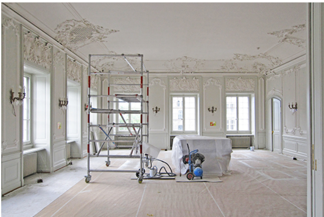
Sanierung ZunftHaus zur Meisen, Zürich, 2018

2018 wurden die Renovationsarbeiten unter der Leitung des Architekturbüros Ruggero Tropeano umgesetzt.