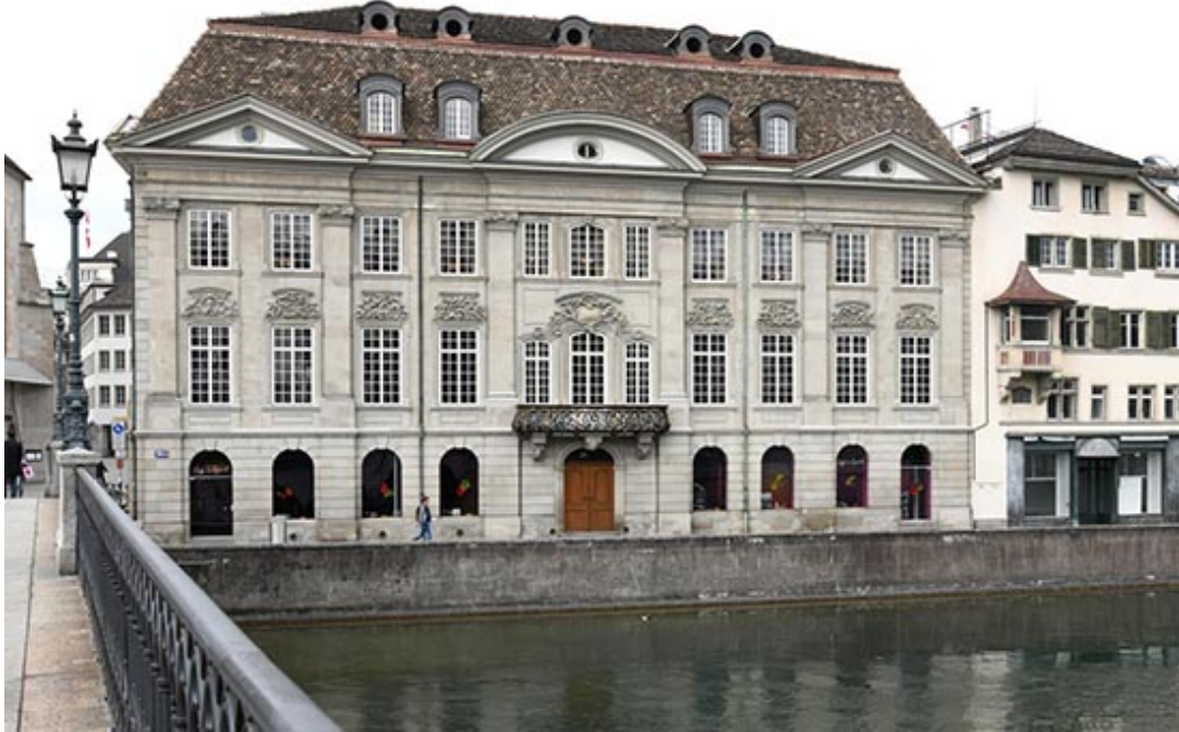
ZunftHaus zur Meisen, Zürich

Im Jahre 2012 plante die Baukommission den unumgänglichen Ersatz des Parketts aus den 1950er-Jahren im historischen Zunftsaal im Piano Nobile. Dabei zeigte sich, dass darüber hinaus am ZunftHaus weiterer beträchtlicher Renovationsbedarf anstand, der in den Folgejahren genauer untersucht wurde.