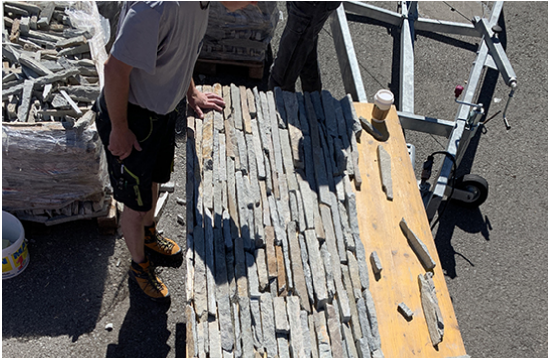
Steinriemchen für die Fassade des Bergrestaurants Gütsch

gewählt. Die Fassade ist in lokalem, gebrochenen Naturstein ausgeführt. Für die Befestigung der Steine wurde mit dem MARMORAN CERAMO System gearbeitet.