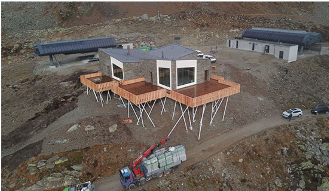
Baustelle Bergrestaurant Gütsch, Studio Seilern Architects und siebzehn13 architekten, Andermatt, 2019