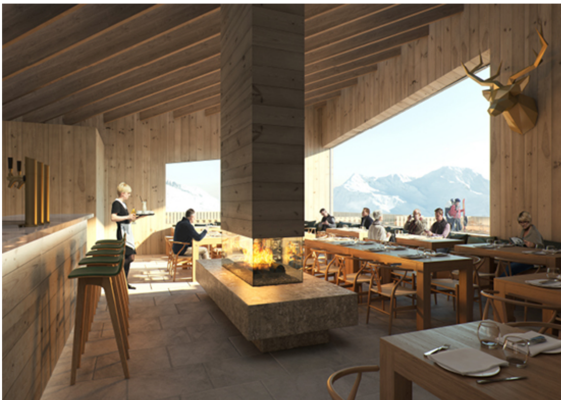
Aussen Stein innen Holz. Visualisierung des Innenraums, Bergrestaurant Gütsch

Das Gesamtvolumen des Restaurants wird aufgebrochen in drei kleinere, scharfkantige Körper und referenziert sich an der Silhouette traditioneller Schweizer Bergdörfer. Die Dachform ist auch im Innern überall klar erkennbar und die Höhen der Nebenräume bleiben auf maximal drei Meter, so dass die Dachstruktur vom Anfang bis Ende des Volumens klar ablesbar ist.