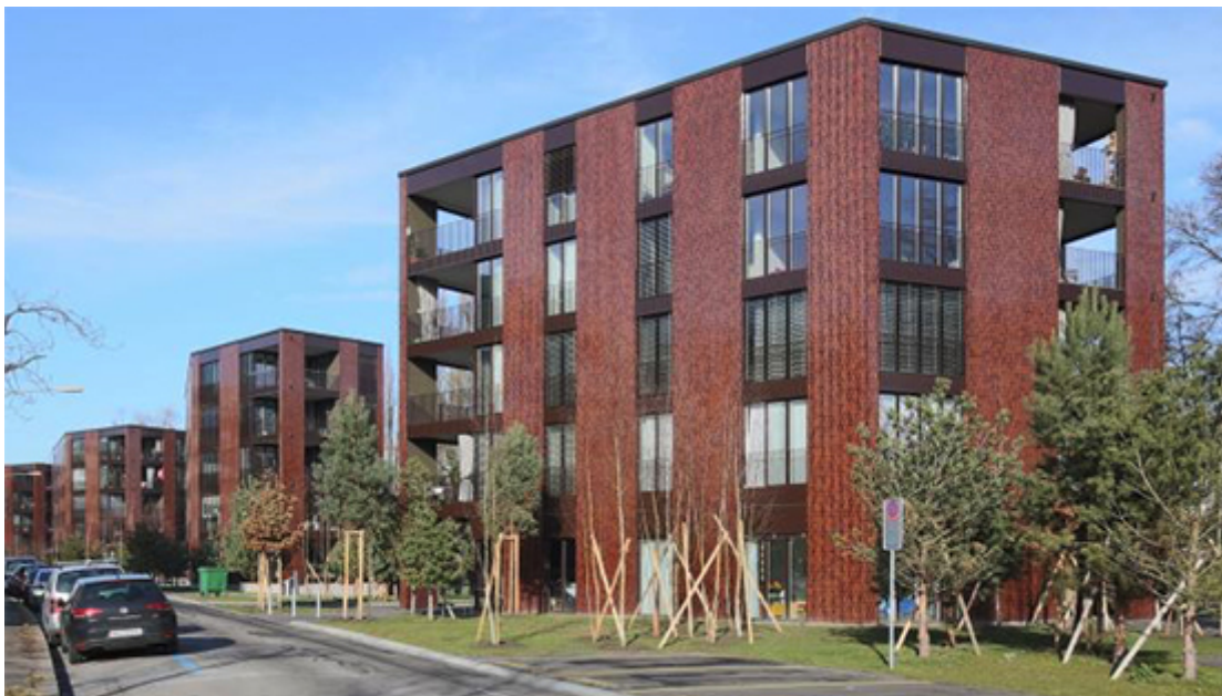
Klinkerriemchenfassade mit MARMORAN CERAMO. Wohnüberbauung Katzenbach IV, ZH-Seebach, EMI Architekten, 2015

Das System MARMORAN CERAMO profitiert von der langjährigen Erfahrung der verputzten Aussenwärmedämmsysteme Marmoran und dem Know-how in der Herstellung von Keramikklebern und Fugenmörtel der Weber Plattenlegerprodukte. MARMORAN CERAMO besteht aus einer Reihe von aufeinander abgestimmten Produkten. Spezielle Armierungsgitter und Panzergewebe aus Textilglas, sowie hocheffiziente Schraubdübeln zur sicheren Befestigung der Dämmung und einem sehr leistungsfähigen Combimörtel gewährleisten die Systemgarantie.