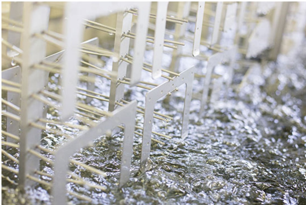
Elektrolyse zur Anodisierung der Aluminiumoberfläche