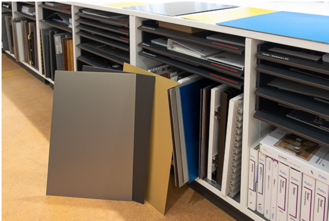
Anodisierte Aluminiumoberflächen von BWB in der SBCZ