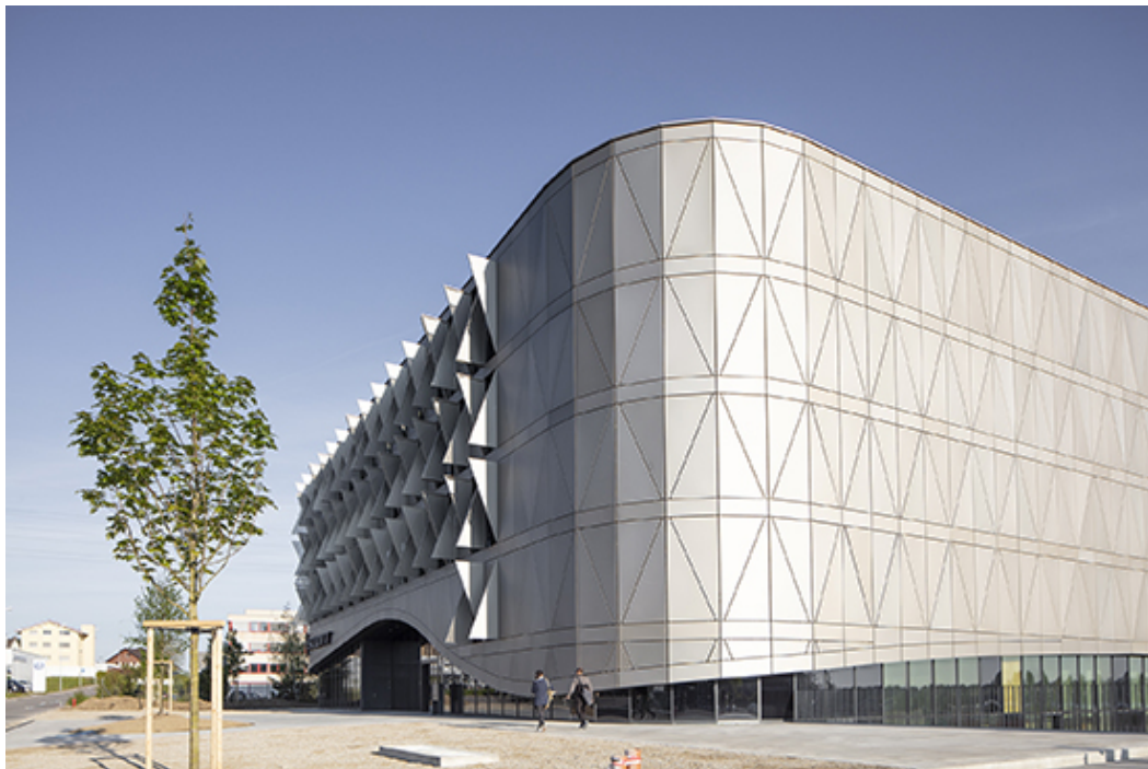
Aluminium Fassade, Scott Sports Centre, Givisiez, Itten+Brechbühl AG, 2015–2019, Foto: Simon Ricklin