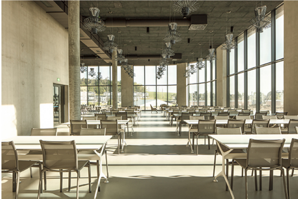
Cafeteria, Scott Sports Centre, Givisiez, Itten+Brechbühl AG, 2015–2019