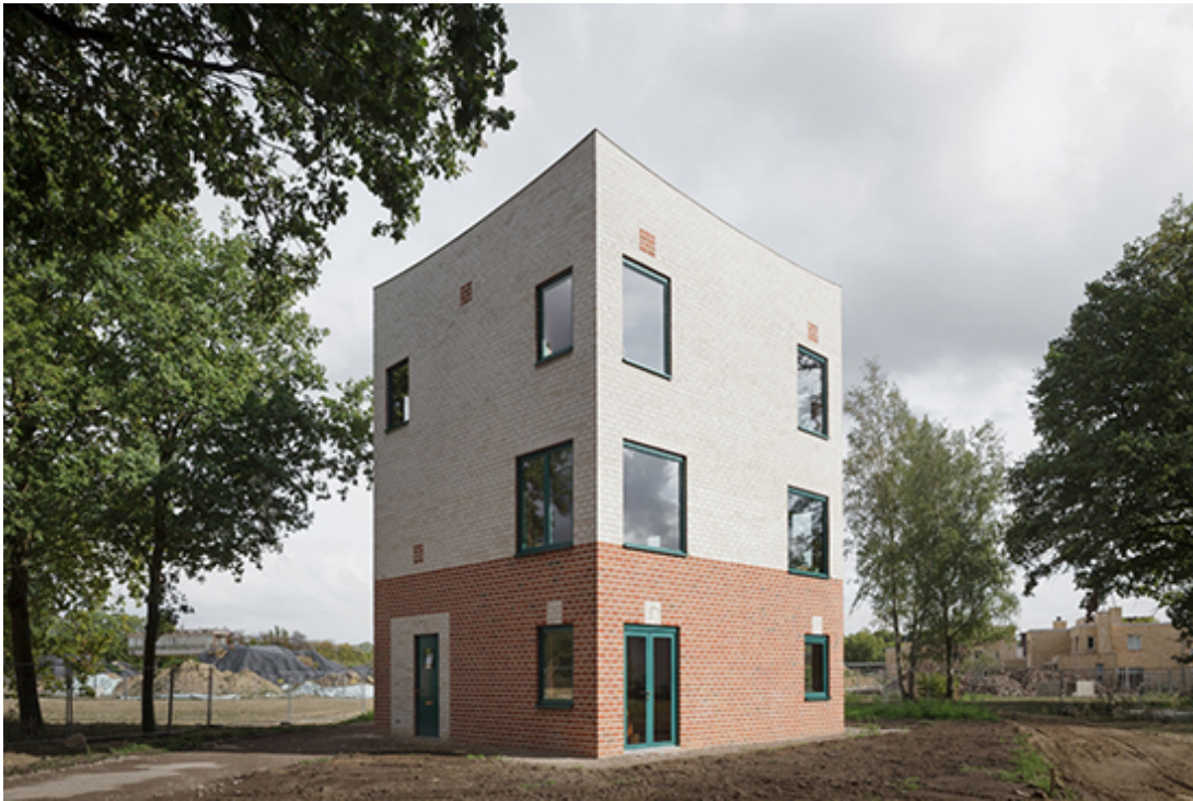
Atlas House, Eindhoven NL, Monadnock 2016