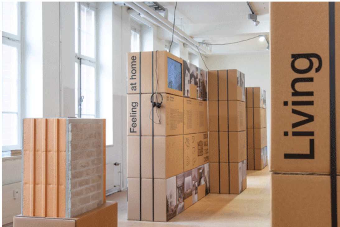
«Brick 18» Thementausstellung präsentiert von ZZ Wancor in der SBCZ