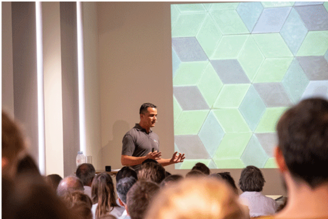
KONKRET - BROWNBAG-LUNCH « pressen, trocknen, legen », Zementfliesen von Plattenladen Zürich GmbH, 29. August