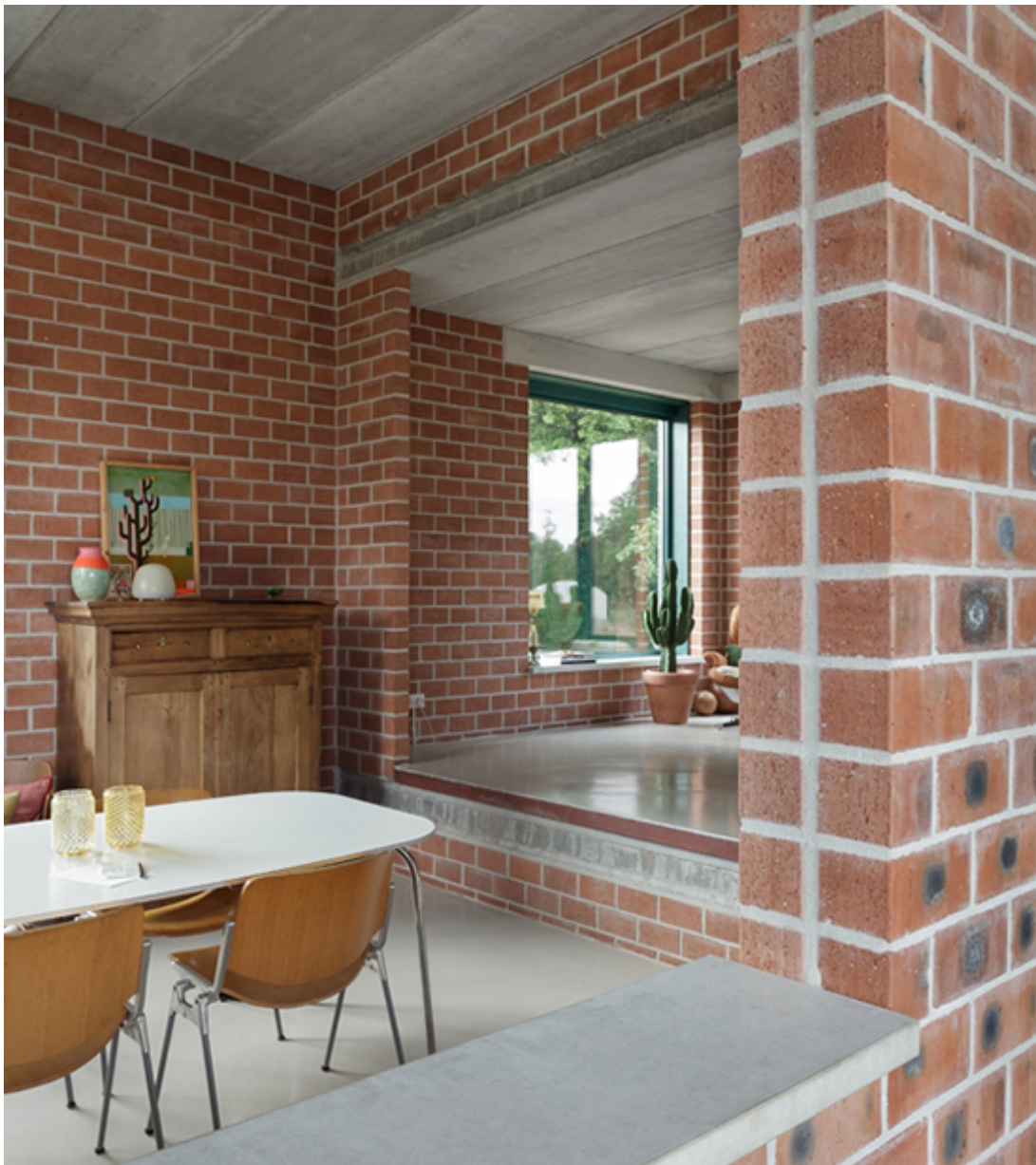
Atlas House, Eindhoven NL, Monadnock 2016

Das Haus ist aus roten Ziegeln errichtet. Aus den Fugen quillt der Mörtel ungeglättet heraus, was seinen robusten archetypischen Charakter betont. Die zweifarbige Front besteht aus einem Sockel und einem leichteren oberen Teil, in den Fensterlaibungen bleiben die roten Ziegel sichtbar. Weisser Zementputz betont den Eingang und erinnert an die niederländische Renaissancetradition, nimmt aber direkt Bezug auf Robert Venturis Feuerwache No. 4 (1974).