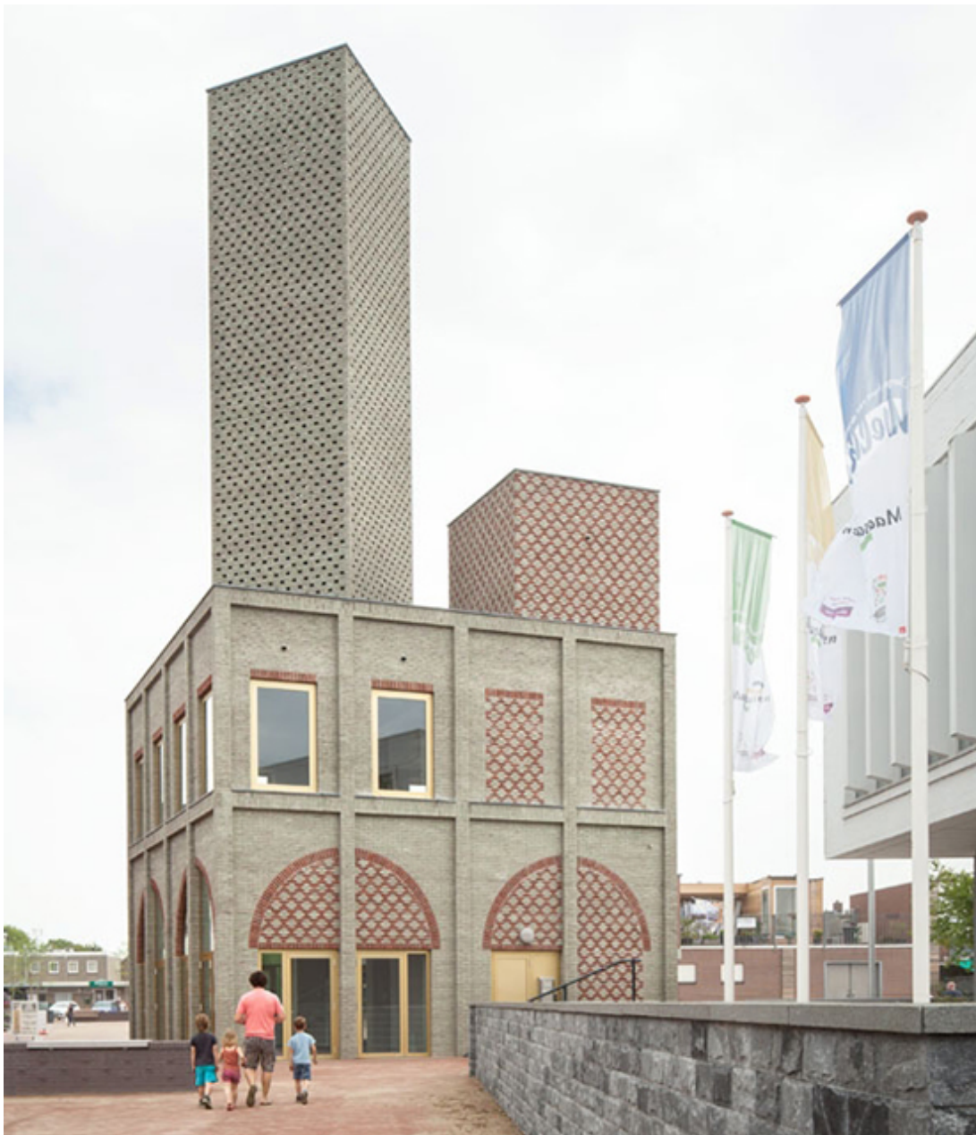
Landmark, Nieuw Bergen NL, Monadnock 2015