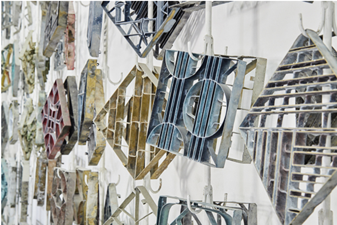
Metallschablonen mit Motiv zur Einfärbung der Platten