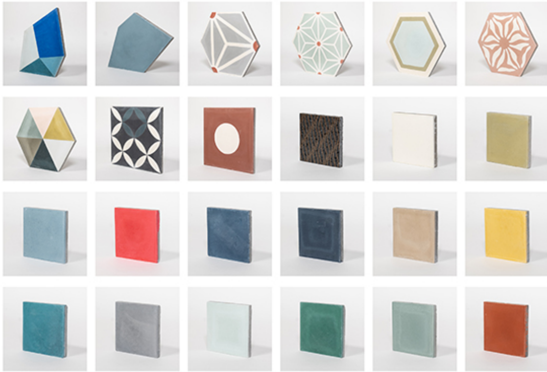
Zementplatten der Plattenladen GmbH in der Ausstellung der SBCZ