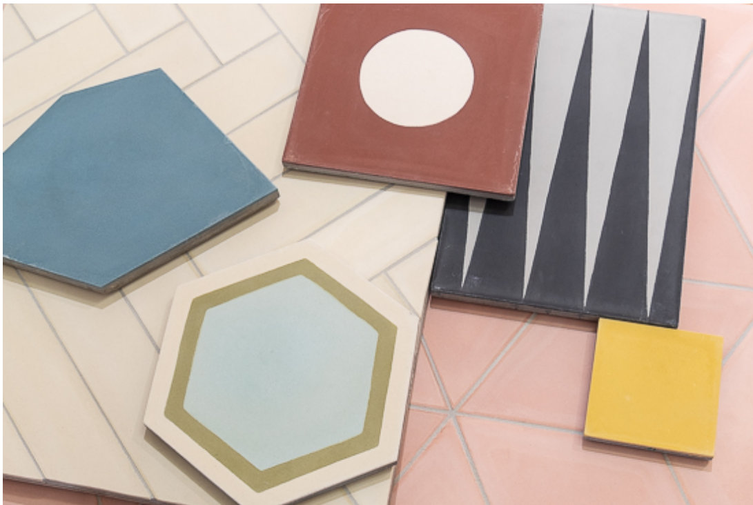
Zementplatten der Plattenladen GmbH in der Ausstellung der SBCZ