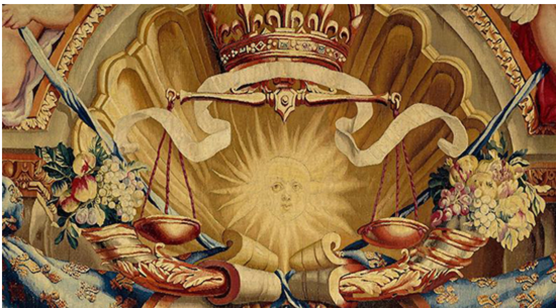
Gobelinbehang zirka 16. Jahrhundert: Gobelin-Tapisserie-Fabrik in Paris

Als Dekoration für den Hochadel hat die Tapete ihren Ursprung im Orient. Bevor man günstige Papiertapeten benutzte, schmückten die Monarchen ihre Wände vor allem mit grossen Wandteppichen. Da diese überaus teuer waren, nahmen die französischen Adligen des 15. Jahrhunderts ihre wertvollen Gobelins bei Reisen von Schloss zu Schloss mit. Im 14. Jahrhundert kamen in Italien erstmals Wandbehänge aus Stoff auf. Nach deren grossem Erfolg, begann in England und Frankreich die Herstellung einheimischer Papiertapeten, so dass bereits 1586 erste Papiertapetenmacher bekannt wurden.