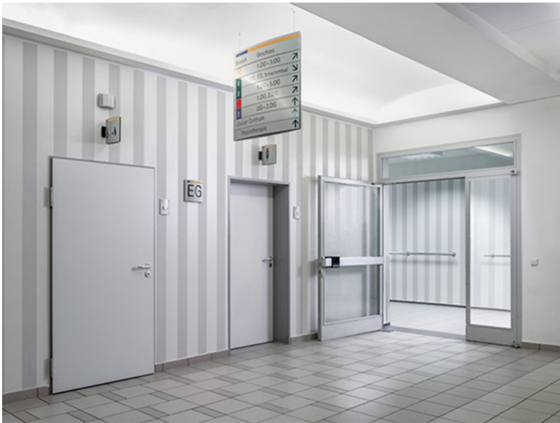
Glasfasertapete im Spitalbereich, Birli Architekten, St. Rochus-Krankenhaus in Dieburg, Deutschland