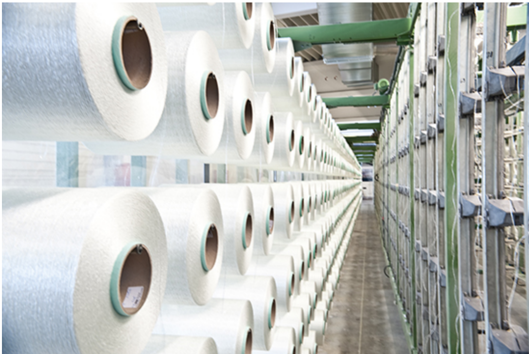
Garnrollen Kettbaum, Bild: Vitrulan Textile Glass GmbH

Die Oberflächenstruktur von Glasvliesen weisen eine feine, regelmässige und ungerichtete Texturierung auf. Das spezielle Armierungs-Glasvlies kann zur Glättung rauer Flächen und Überbrückung von Schwund- und Trocknungsrisse eingesetzt werden. Die Produktereihe FantasticFleece bietet spezielle Glasvliese für farbige Lasur- und Effektbeschichtungen und mit glatten Oberflächen in zweifarbiger Optik.