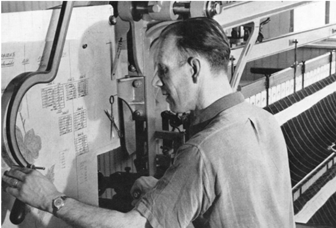
Historische Aufnahme. Bedienung einer Stickereimaschine bei Bischoff Textil AG

Einhergehend mit dem Wandel in der Textilwirtschaft fokussierte das Unternehmen vermehrt auch auf die Produktion und den Vertrieb von Heimtextilien. Mit der Gründung der Bischoff Interior AG im Frühjahr 2017 wurde ein wichtiger strategischer Entscheid in die Tat umgesetzt. Die Vision, das traditionelle Stickerei-Handwerk als Gestaltungselement für die zeitgenössische Architektur und in öffentlichen Gebäuden aufzubereiten, wurde in die Tat umgesetzt.