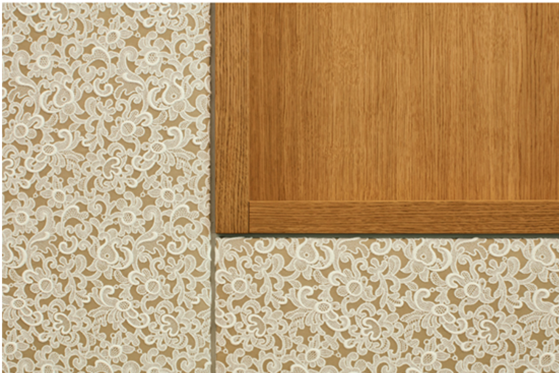
Wandverkleidung Trauzimmer Gemeindehaus, Uzwil, 2017, raumfindung architekten eth bsa sia.

Im 2017 fertiggestellten Gemeindehaus von Uzwil (SG) von raumfindung Architekten wurde das Thema der Stickerei aufgegriffen und neu interpretiert. Im Dachgeschoss des Gemeindehauses findet eine räumliche Sequenz ihren Abschluss mit dem Trauzimmer. Um dem Raum eine aussergewöhnliche, festliche und einzigartige Stimmung zu verleihen wurden moderne Stickereien eingesetzt. Zusammen mit Bischoff Interior AG wurde nach Vorlage einer historischen Schifflistickerei aus dem Textilmuseum St. Gallen eine Textilie nachproduziert, mit welcher die Wandpaneele bezogen wurden.