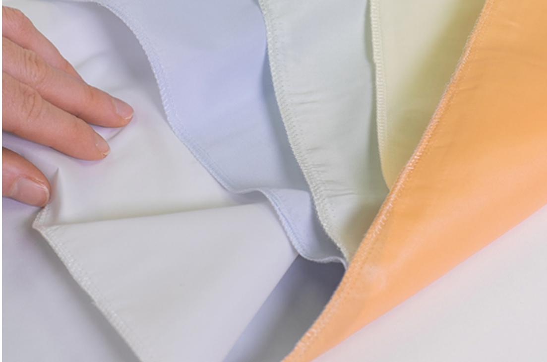
antibakterielle Funktionsstoffe Aquasol in der SBCZ Materialsammlung

Vorhangstoffe sorgen für die nötige Sicherheit, schallhemmende Stoffe für eine gute Raumakustik oder antibakterielle Stoffe, die für hygienische Sauberkeit sorgen. Bei den permanent bioaktiven Funktionsstoffen von Bischoff Interior AG sind Silberionen fest in der Faser verankert und hemmen das Wachstum von Bakterien. Die Fasern wirken somit Infektionen wie MRSA (Methicillin-resistent Staphylococcus aureus) im Spital entgegen. Ebenso reduzieren diese Stoffe eine durch Mikroben verursachte Geruchsbildung. Auch häufiges Waschen mindert die Funktion nicht, da sie im Garn integriert und nicht nachgerüstet ist.