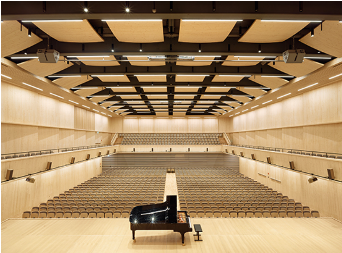
Klangkörper Tonhalle Zürich, spillmann echsle architekten 2017

Die Firma Müller-BBM ist ein seit 1962 international tätiges Ingenieurbüro mit Sitz in Planegg bei München und weltweit eines der führenden Unternehmen in der akustischen Planung und Beratung von Kultur- und Veranstaltungsgebäuden. Das Unternehmen ist mit über 400 Mitarbeitenden an dreizehn Standorten in Deutschland, Österreich und der Schweiz vertreten. Die Firma verfügt über ein umfassendes Know-how auf allen Gebieten der Raum- und Bauakustik, der Elektroakustik, der Medien- und Kommunikationstechnik sowie der Bauphysik. Das Ingenieurbüro verfügt über hauseigene Akustiklabors und Prüfstände, ähnlich der Empa in Dübendorf, und ist so in der Lage alle notwendigen Prüfungen hausintern abzuwickeln.