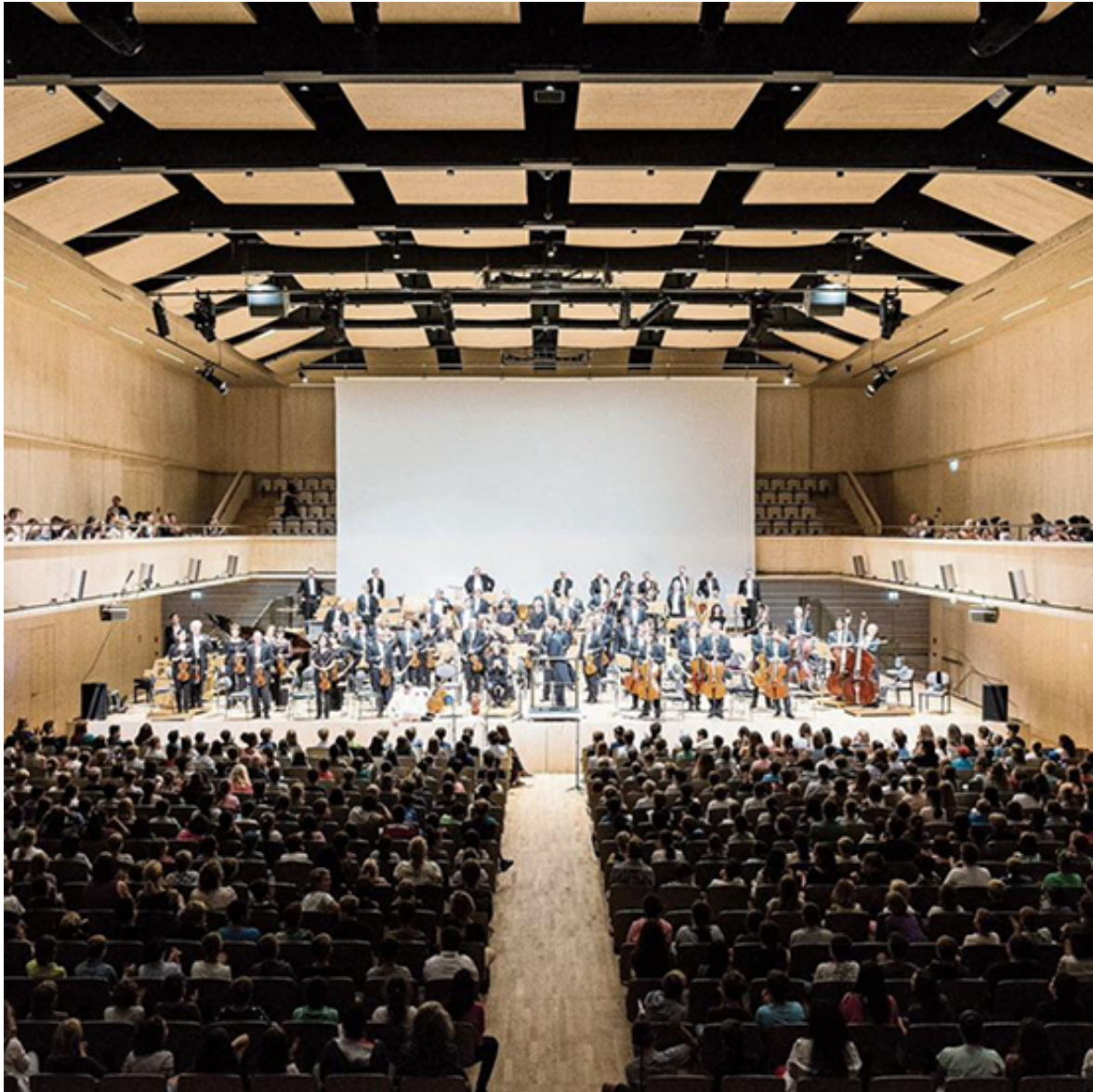
Eröffnungskonzert Tonhalle Maag 2017