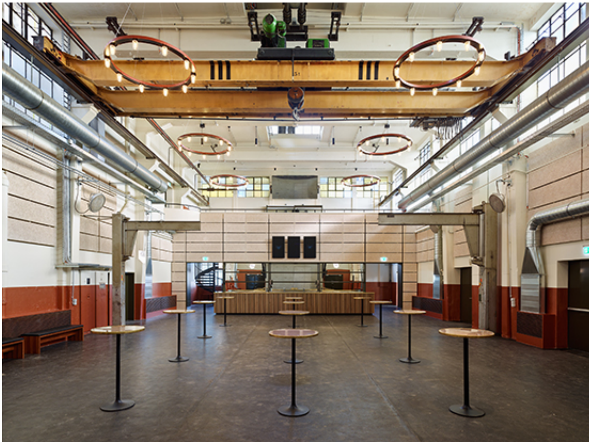
Tonhalle Foyer, spillmann echsle architekten 2017, Bild © Hannes-Henz