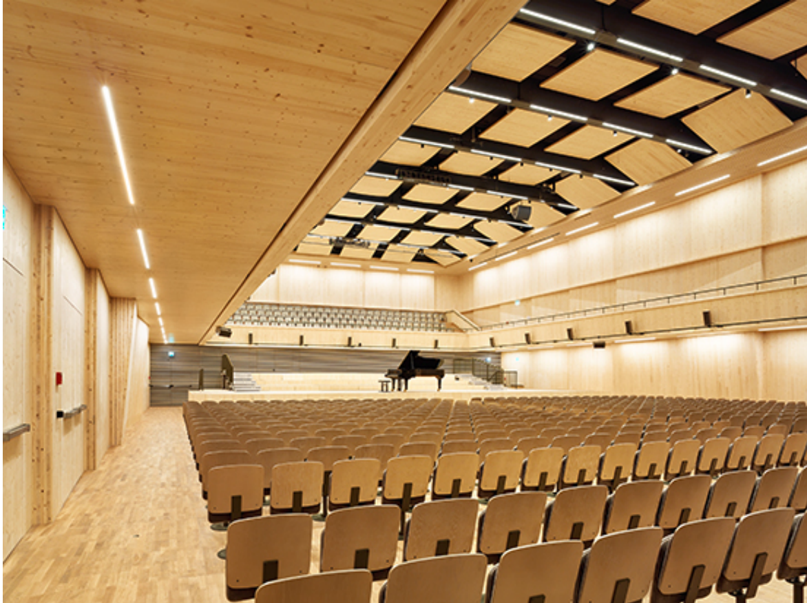
Hölzerner Innenraum, spillmann echsle architekten 2017, Bild © Hannes-Henz

Holzpaneele an Ketten aufgehängt. Jene über der Hauptbühne sind zudem konvex geformt. Der Raum verfügt über 1224 Sitzplätze. Millionen schräg gebohrter Löcher im Eichenfußboden gewährleisten den Austritt von Zuluft ohne Geräuschbildung.