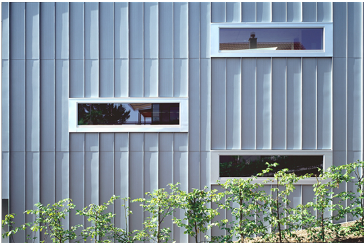
Einfamilienhaus am Hammerweg in Winterthur, Beat Rothen Architektur, 2002