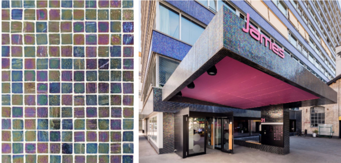
Hinterlüftetes Fassadensystem mit Glasmosaikbekleidung, Überbauung James Albisrieden, Gmür & Geschwentner Architekten AG