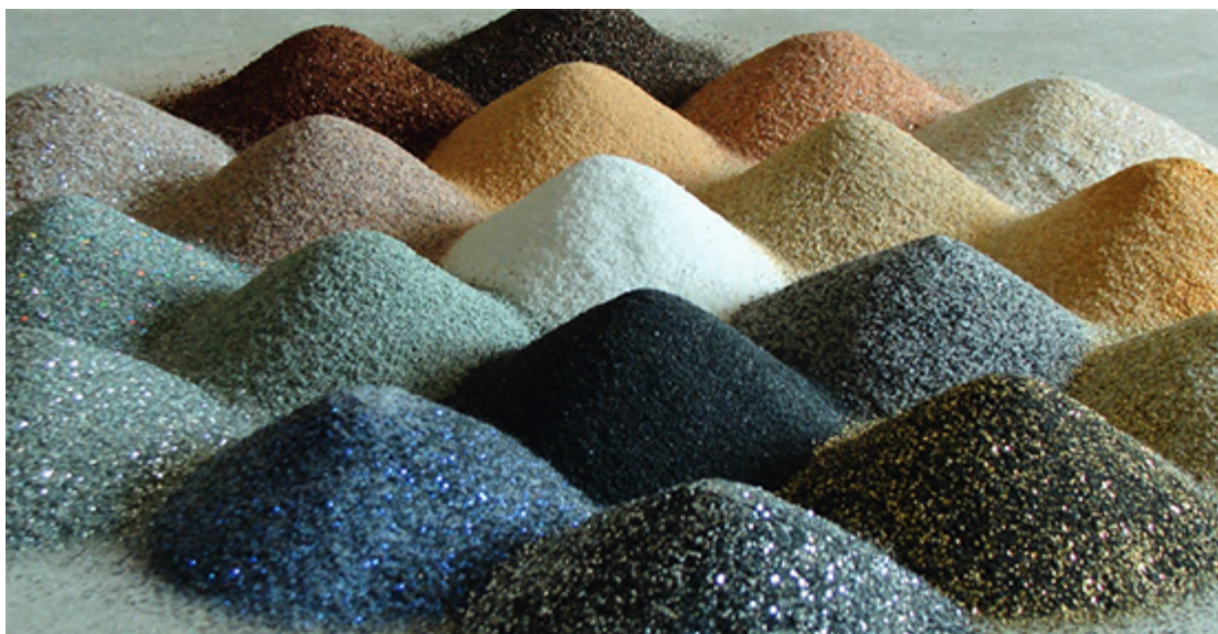
Diverse Rohstoffe als Grundlage für Verputze

Ein Verputz kann manches sein. Untergrund zum beschichten, fliesen, streichen oder tapezieren bis hin zur grossflächigen strukturierten Gestaltung. Er reguliert die Raumfeuchte bei Innenputzen, übernimmt den Schutz der darunterliegenden Bauteile oder ist Teil eines Wärmedämmverbundsystemes. Putze bestehen aus mehreren aufeinander abgestimmten Lagen, die zusammen ein Putzsystem bilden.