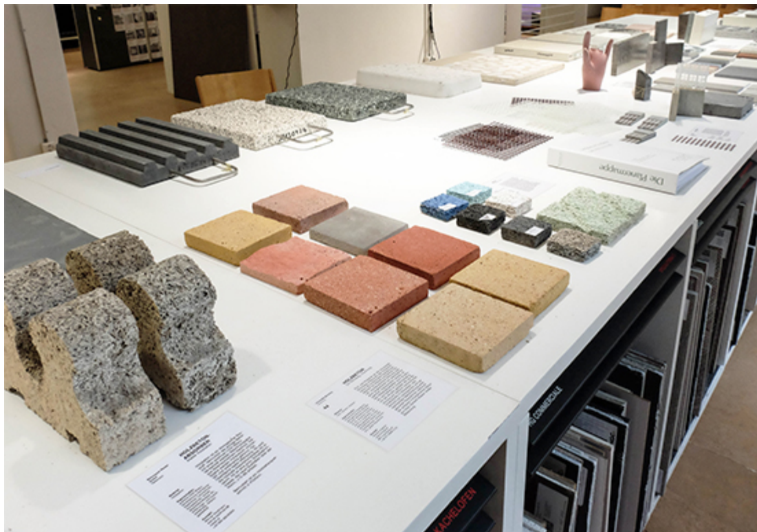
Holzbeton Akustikabsorber als funktionale Gestaltungselemente

Einen ausführlichen Bericht über die Ausstellung finden Sie auf der TEC21 Webseite von espazium.