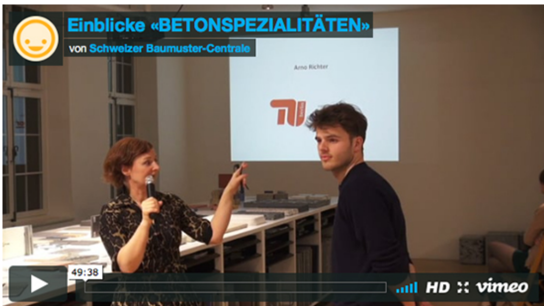
Video der Eröffnungsveranstaltung mit Pecha Kucha. 23. Februar 2017