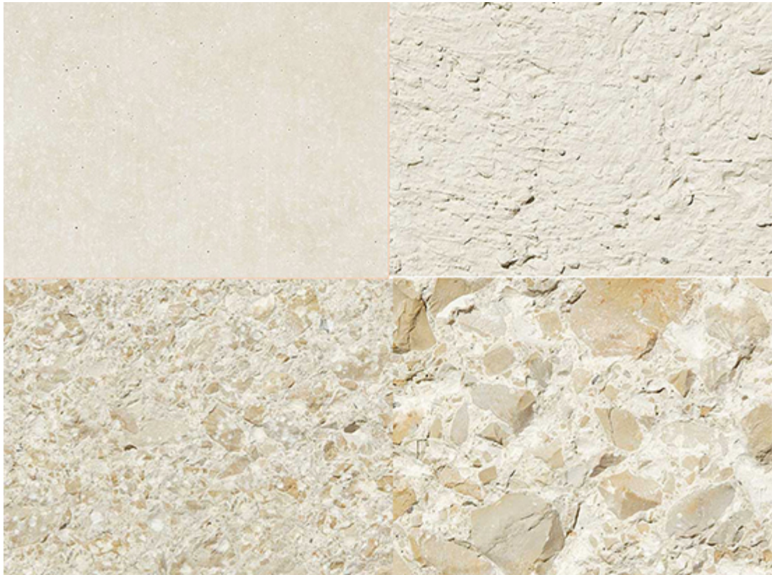
Im Uhrzeigersinn von oben links: Schalungsglatt, abgerieben, gespitzt, gestockt

Unser Partner MTextur liefert dazu Texturen zum kostenlosen Herunterladen und Weiterverwendung in Ihren CAD-Programmen. Ammocret®-Kalksteinbeton in Kombination mit Graubeton oder anderen Baumaterialien ermöglicht spannende Kontraste.