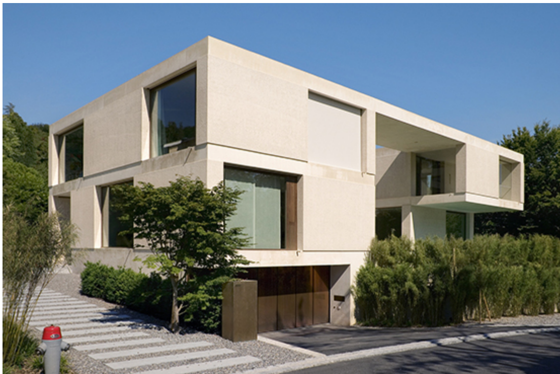
Wohnhaus Küsnacht, 2003 wild bär heule architekten

Der Baustoff vereint die Vorteile von Beton mit dem warmen Grundton des lokalen Jurakalksteins. Für die Herstellung werden saubere Kalksteinbrocken ohne Mergel- und Tonanteile verwendet. Das Beimengen von anderen Zuschlagstoffen führt zu immensen Gestaltungsmöglichkeiten.