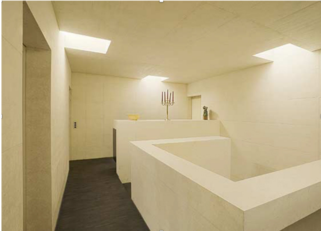
Spiel der Formen und Kanten, Wohnhaus, Burkhard, Meyer Architekten BSA, Baden

Seit den Anfängen der menschlichen Besiedlung wird Jura-Kalkstein als Baustoff verwendet. Seine leichte Abbaubarkeit war in früheren Zeiten für den Bau von Burgen und Häusern der Oberschicht ein wichtiges Besiedlungskriterium. Vor allem massive Stücke lieferten die Mauersteine.