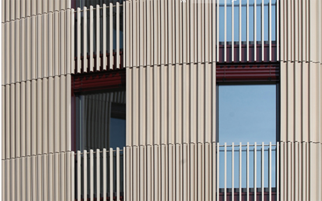
Terra Cotta Fassade, studentisches Wohnen, «Science-City» Höngrgerberg ZH, architektick Architekten 2016

Das Familienunternehmen wurde im Jahr 1927 in Emmerich am Rhein, Deutschland gegründet. Seit 2007 gehört NBK zur Amerikanischen Hunter Douglas Group und ist in der Architekturszene bekannt für innovative Lösungen für Keramikfassaden. Gasser Fassadentechnik AG ist die Schweizer Vertretung von NBK Keramik GmbH.