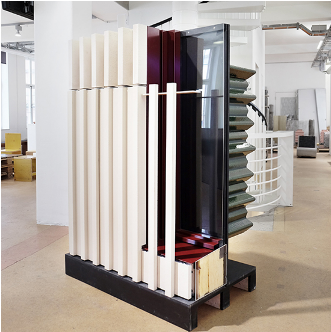
Mockup der Fassadenkonstruktion studentisches Wohnen, «Science-City», in der SBCZ «Be-Greifbar».