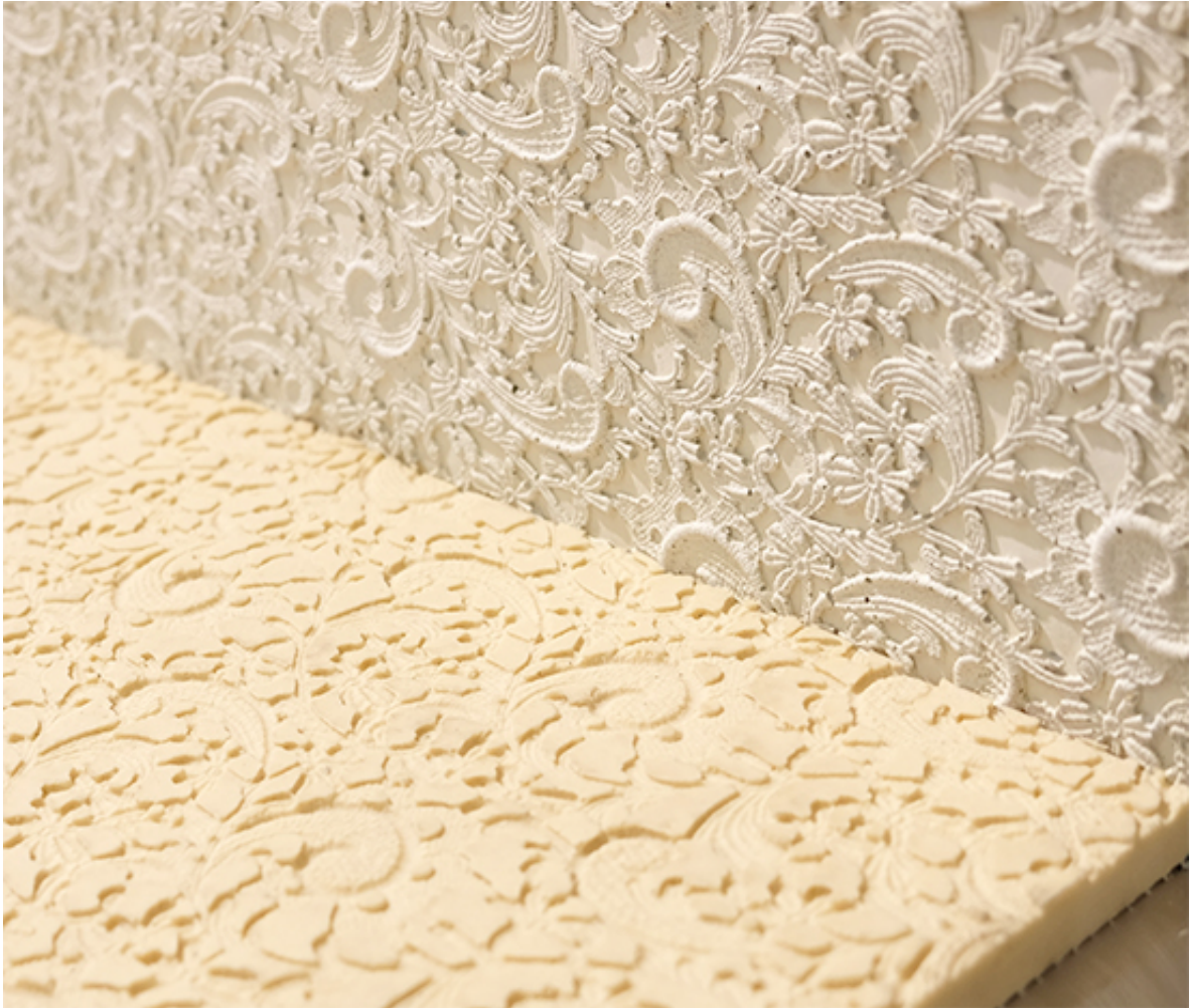
Polyurethan Schalungseinlage. Vorlage: St Galler Spitzen

Dekoration und Blickfang im Sichtbetontreppenhaus der geplanten Alterssiedlung «Argentum» in St. Gallen. Abguss von einer Original-St. Galler-Spitze