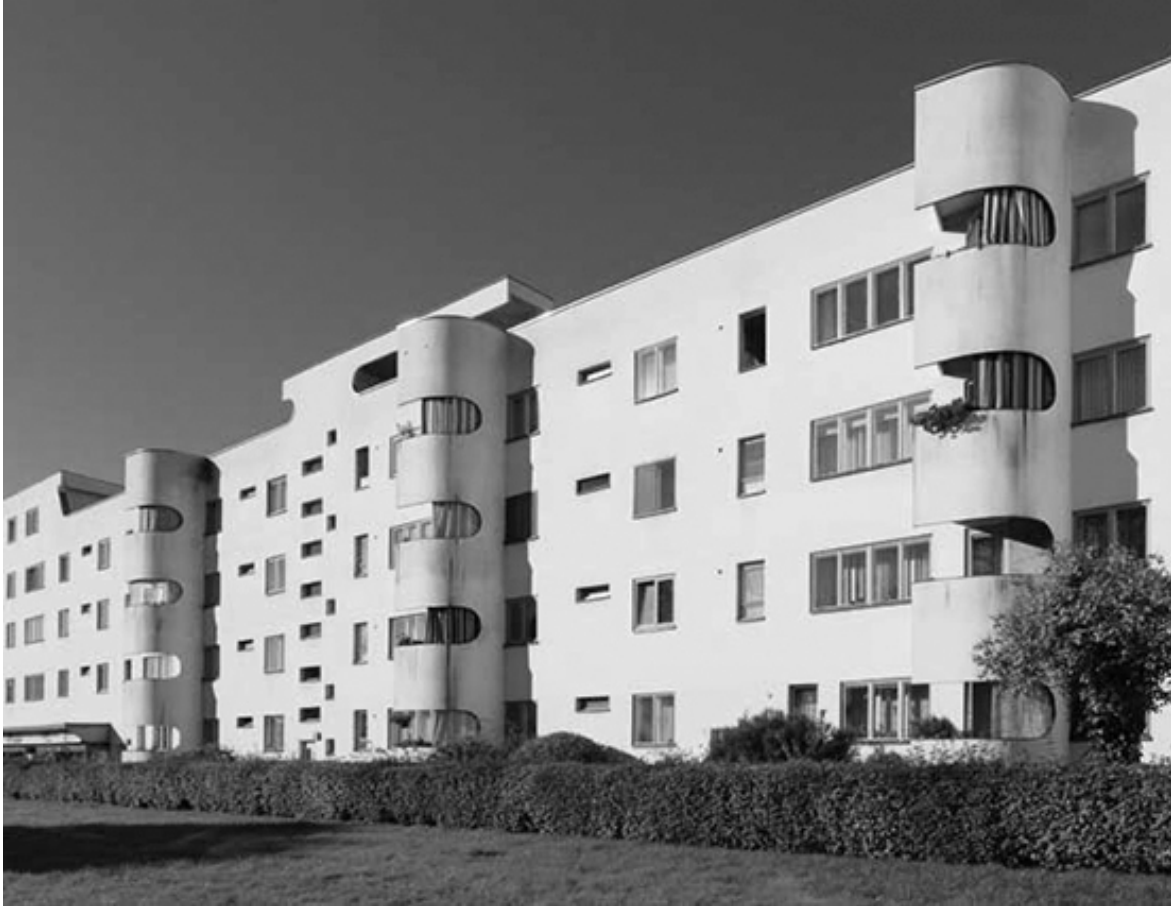
Meisterhäuser: Hans Scharoun 1931, IBA Stuttgart