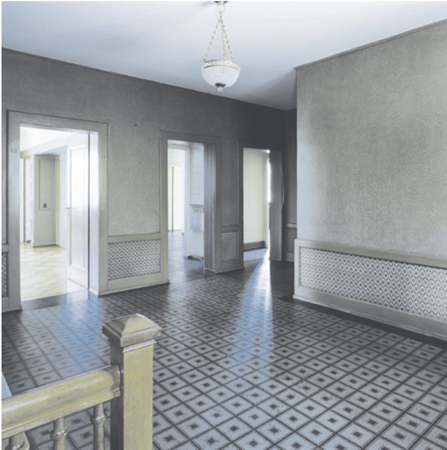
Linoleumboden von Peter Behrens in der Villa Mooser-Nef in Wollishofen am Zürichsee aus dem Jahre 1912