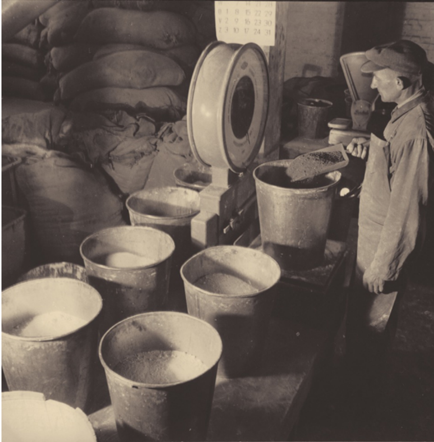
Genaueres Abwägen der Rohmaterialien.