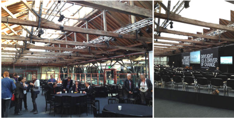
Tobacco Dock East London

Die Konferenz fand ohne künstliche Beleuchtung und Lüftung unter dem Gebälk des vorindustriellen Tabaklagers von 1811 statt. Referenten wie David Nelson, Partner bei Foster und Partners Architekten - Tageslicht in Büroumgebungen, Paul Bogard, Forscher und Autor «The End of Night» - Lichtverschmutzung des Nachthimmels oder Olafur Eliasson, Künstler und Gründer der «Little Sun» - Licht nach Sonnenuntergang für Menschen ohne Zugang zum Stromnetz «beleuchteten» das Thema in all seinen Facetten, ganzheitlich und nicht nur Bauteilbezogen.