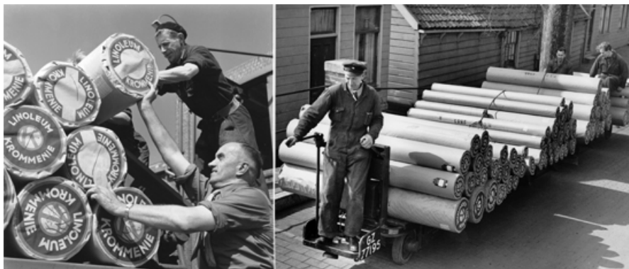
Versandfertiger Linoleum von ano dazumal.