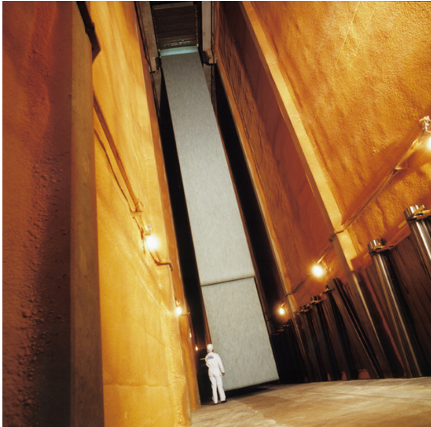
Reifekammer für Linoleumbahnen.

Linoleum ist der einzige elastische Bodenbelag aus überwiegend nachwachsenden Rohstoffen. Er besteht zu 98 % aus Leinöl (aus Leinsamen gepresst), Holzmehl, Naturharzen und Jute. Der fertige Linoleumzement wird in einen Strang gepresst und in portionsfertige Stücke geschnitten. Diese werden mit dem Holzmehl, Kalksteinpulver und Farbstoffen gleichmässig vermischt und geknetet. Nach mehreren Mischdurchgängen ergibt sich schliesslich eine homogene und krümelige Masse die vor riesige Kalandervalzen auf das Jute-Trägermaterial geschüttet wird. Diese pressen die Masse auf die Jute, wodurch sich beide Materialien fest miteinander verbinden. So entstehen bis zu 30 Meter lange Linoleumbahnen, die zum Nachreifen in riesigen bis zu 15 Meter hohen Reifekammern zwei bis vier Wochen aufgehängt werden.