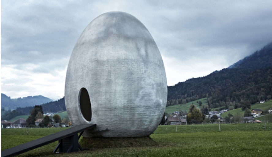
Riesenei im Bregenzerwald, Oberhauser & Schedler aus UHFB und mit Hilfe einer pneumatischen Schalung.