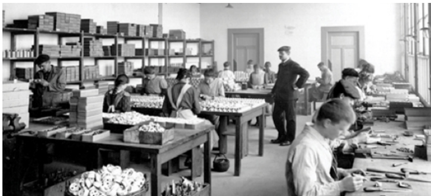
Feller Montagesaal in Horgen 1917