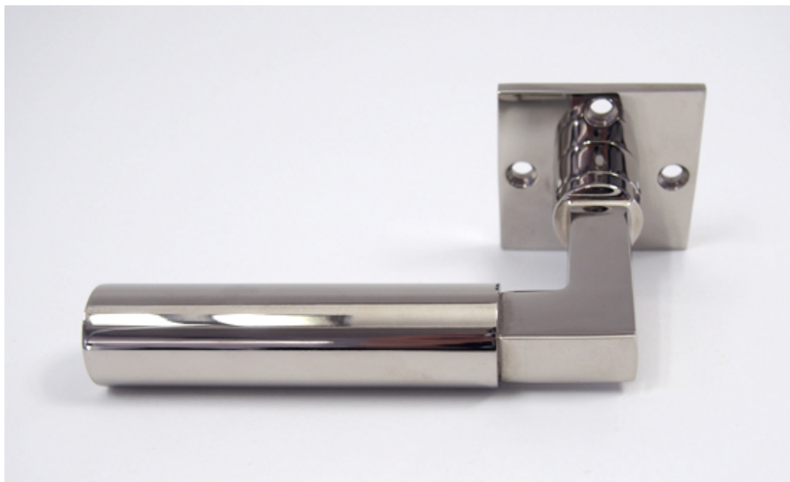
Neuaufgabe in Edelstahl, Türdrücker von Walter Gropius, 1923 erstmals produziert von der Fa. S.A. Loevy