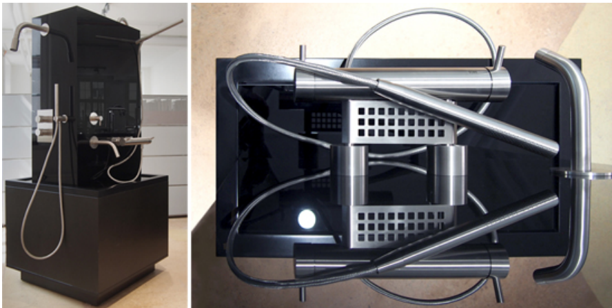
Edelstahl Armaturen aus dem Sortiment von Beschläge U.S.W. AG. Design Knud Holscher, in der SBCZ «be-greifbar»

2012 erfolgte die Ausschreibung eines Architekturwettbewerbs für das Gestalten von Türdrückern. Von 75 Eingaben sind 15 Arbeiten als Prototypen für eine Publikumsbewertung aufgelegt worden. Aus diesem Wettbewerb sind sechs neue Beschlägelines in das Verkaufsprogramm von Beschläge U.S.W. AG aufgenommen worden. Die Suche geht weiter, mit neuen Legierungen und Oberflächenbehandlungen auf den Entwurf von Bauten abgestimmt.