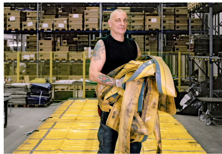
Ausbreiten und Zerlegen der Planen