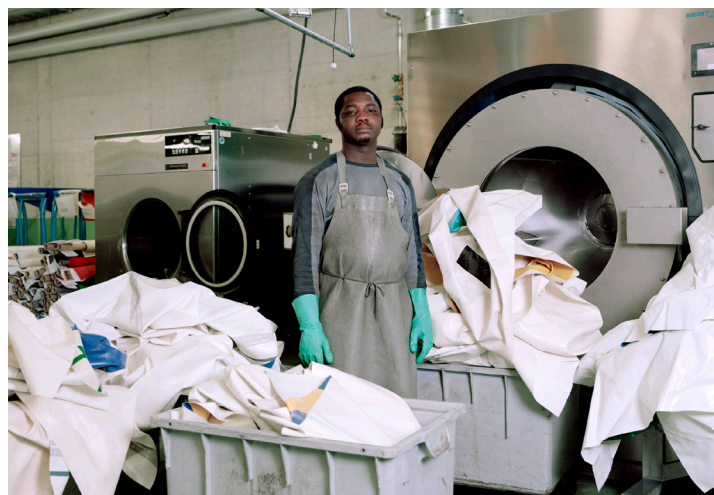
Waschen der Planen