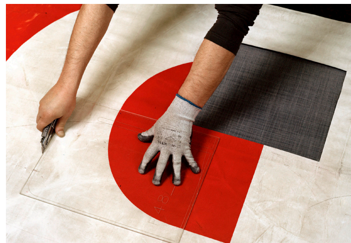
Zuschneiden der Planen für FREITAG-Taschen

fall gleich Nährstoffe, eine einfache Rechnung. Abfall konnte also nur gut sein. Wie recycelter Müll, der in seine einzelnen Rohmaterialien zurück- und einer neuen Nutzung zugeführt werden kann.