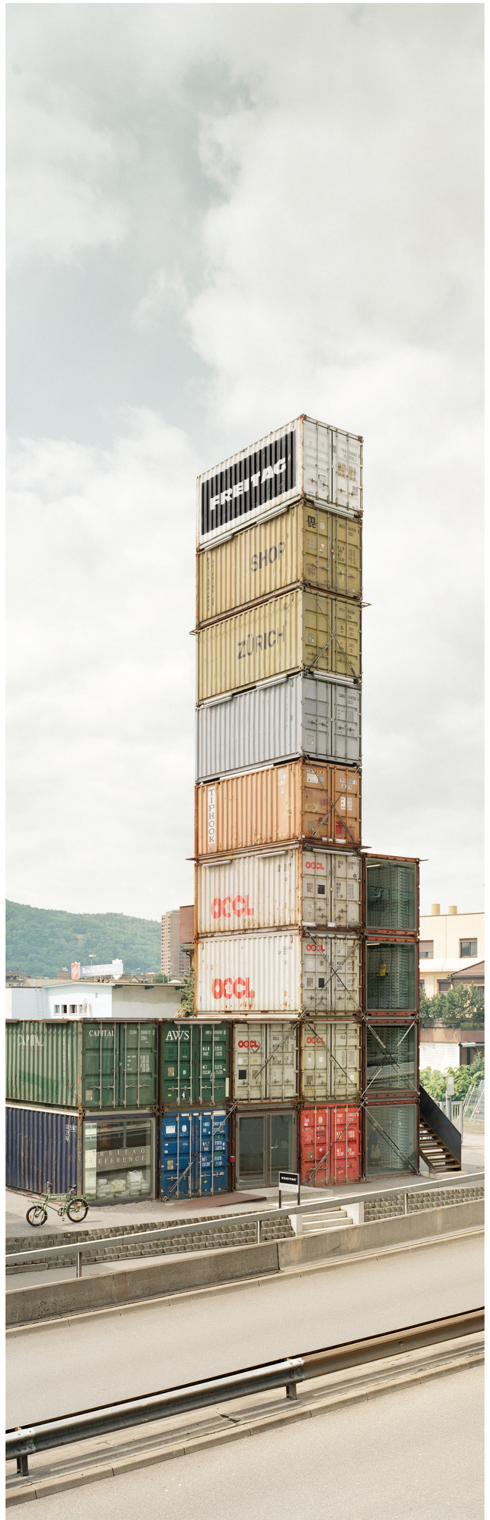
FREITAG-Flagship-Store Hardbrücke, Zürich

Nach und nach wurde auch in nahen Ateliers, die alle in kurzen Wegen, zu Fuß oder mit dem