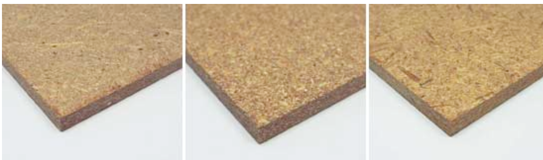
Gerstenspreu, Maiskolben, Weizenspreu

Den Zusammenhalt der Bauplatten sichern ebenfalls natürliche Rohstoffe wie Tannin, einen aus der Baumrinde gewonnenen und formaldehydfreien, natürlichen Klebstoff. Die entwickelten Platten wurden diversen Tests unterzogen und mit den durch die EN Standards für Baumaterial vorgegebenen Richtwerten verglichen. Um das Produkt in Nigeria einzuführen, sucht das Projektteam nun einen Partner vor Ort. Zudem soll ein prototypisches Haus gebaut werden.