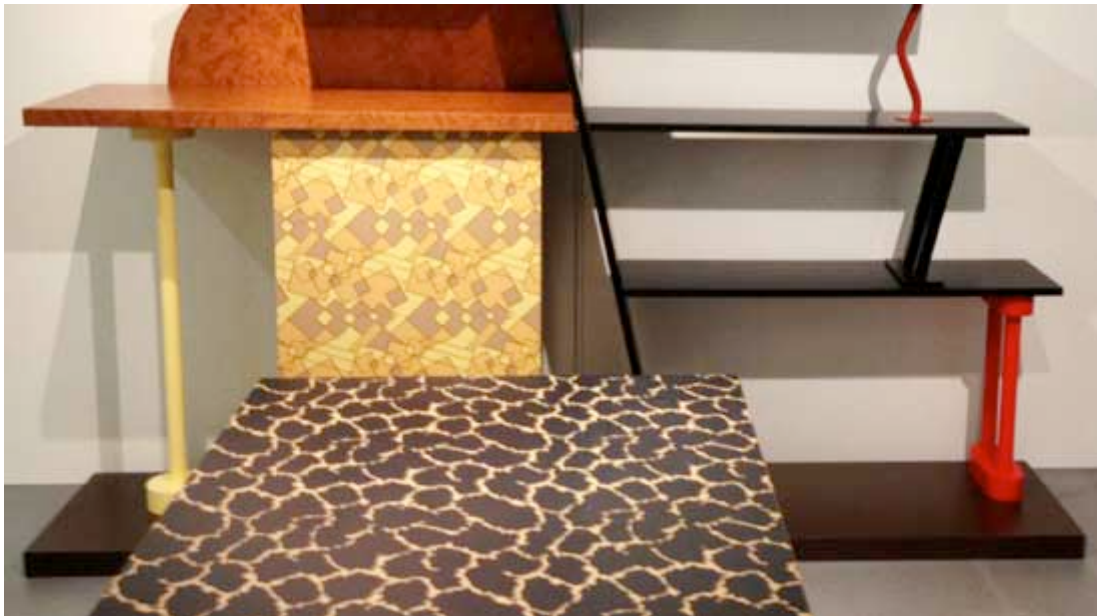
Ettore Sottsass, 1982

Ungefähr 300 geladene Gäste aus aller Welt durften am 8. Juni 2013 an der feierlichen Eröffnung des Museo ABET Laminati in Bra (CN) im Piedmont, südlich von Turin, teilnehmen. Das Städtchen mitten im Weingebiet beherbergt den Hauptsitz des 1957 gegründeten Kunststoffherstellers ABET LAMINATI S.p.A. ABET zusammengesetzt aus den Anfangsbuchstaben von A Associazione, B Braidese, E Estratti, T Tannici oder Aktiengesellschaft von Bra für Extrakte aus Tannin - ein Gerbstoff verwendet in der Lederverarbeitung was auf den Ursprung der Firma hinweist.