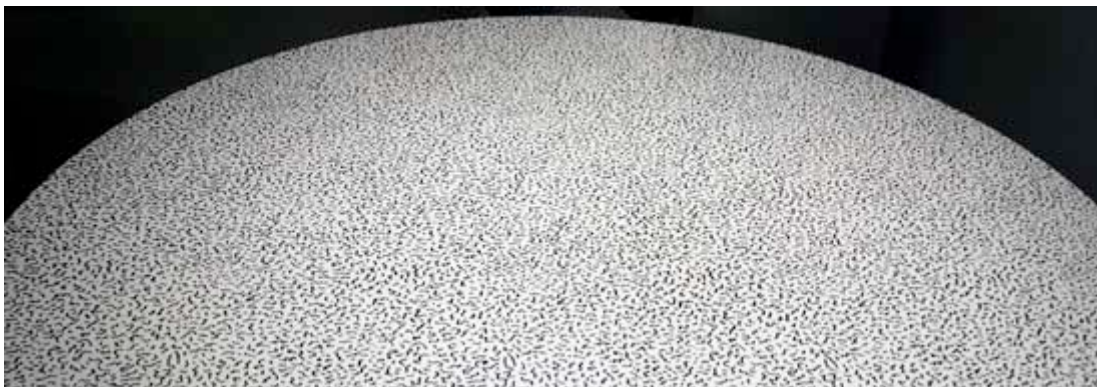
Ettore Sottsass, 1984

Die Firma hat in den letzten 50 Jahren zusammen mit unzähligen Architekten und Designern hunderte von Dekors zu Laminaten verarbeitet. Während der Postmoderne der 1980-er Jahre entstand eine enge Zusammenarbeit mit Ettore Sottsass (1917 - 2007) und seiner Memphisgruppe.