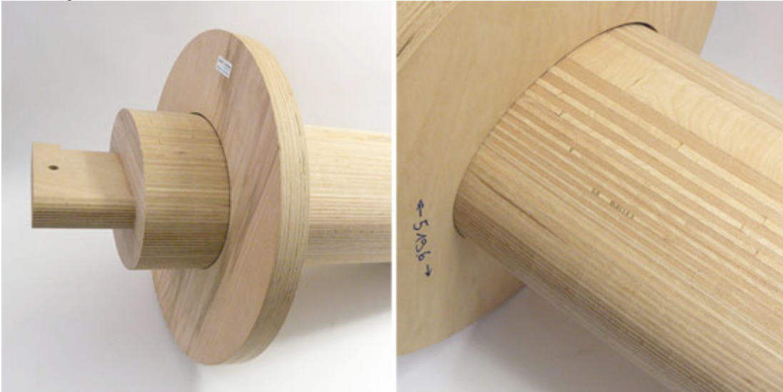
Einer der Verbindungen «-zapfen» aus verleimten Buchenlamellen