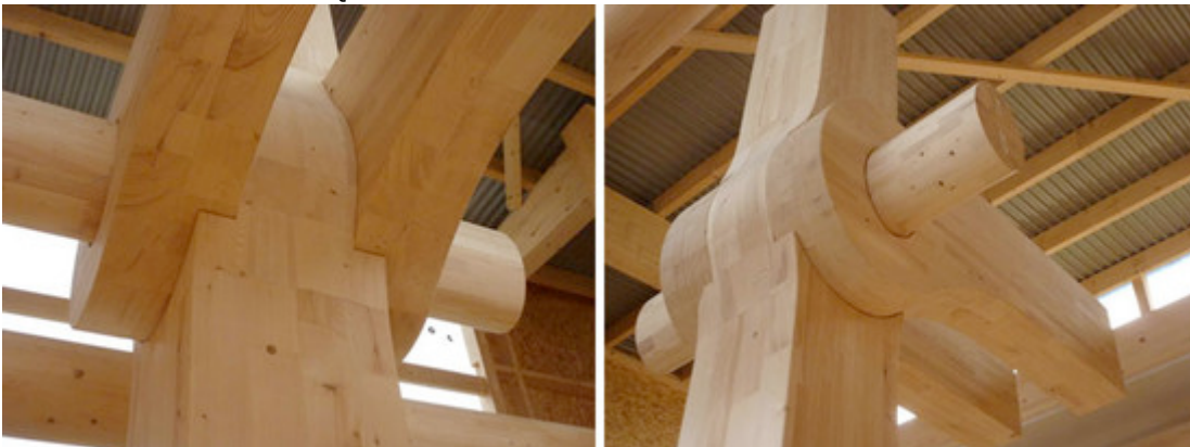
Stützen-Trägerverbindung im Tamediahaus

Verwendet werden einheimische Hölzer, Fichte und ein kleiner Teil Buche, welche auf CNC gesteuerten Fräsen auf die notwendigen Querschnitte bearbeitet werden. Die Verleimung der Holzlamellen geschieht industriell und verlangt ein Höchstmass an Präzision und Qualitätsbewusstsein.