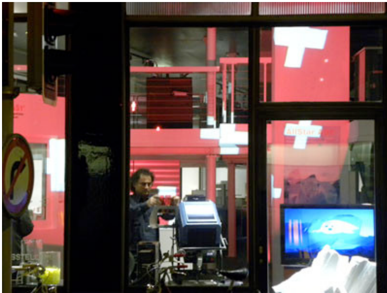
Light Art by Gerry Hofstetter