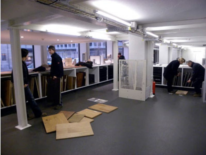
SBC.2 am Samstag 9. Januar 2010

Sehr geehrte Damen und Herren, liebe Freunde der SBC.2 / SBCZ