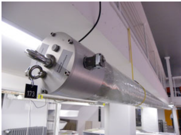
Weihnachtsbeleuchtung Bahnhofstrasse, Zürich, 2003-2009

Die Schweizer Baumuster-Centrale bleibt vom 24. Dezember 2009 bis und mit dem 3. Januar 2010 geschlossen . Gerne sind wir im neuen Jahr wieder für Sie da und danken Ihnen für das Interesse.