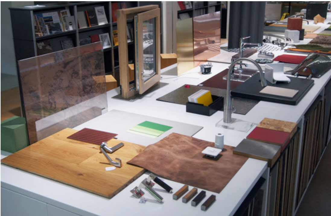
Das kreative Chaos als Ausgangspunkt für neue Materialkombinationen